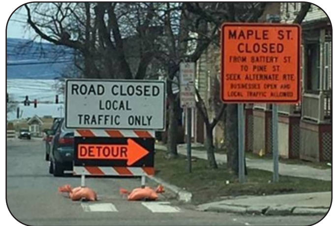
Wakati wa ujenzi, njia za gari na za watembea kwa miguu zitakuwa muhimu kwa nyakati tofauti katika maeneo tofauti.

Maple na King Street Neighborhood, Pine street itarekebishwa na njia mpya za barabara za watembea kwa miguu zitawekwa. Alama za trafiki zitawekwa Pine steret katika Maple na King street.