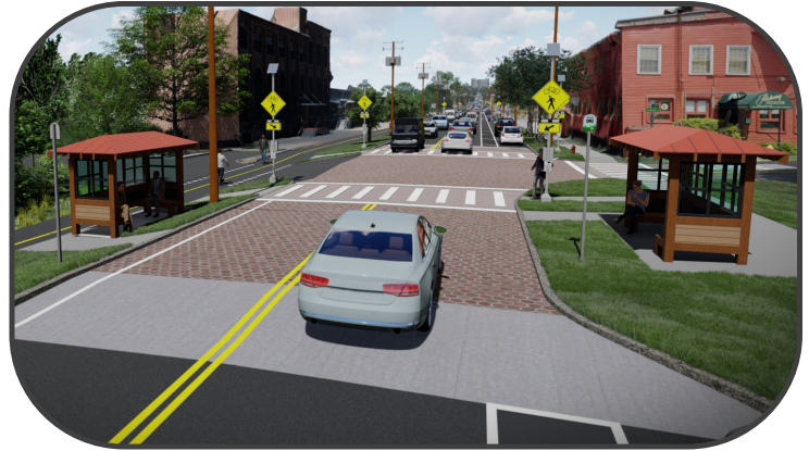
Champlain Parkway တွင် ကားပိတ်စီးသူများ၏ အတွေးအခေါ်တိုးတက်စေရန် ဘတ်စ်ကားဂိတ် အသစ်များ ပါဝင်ပါမည်။

Champlain Parkway သည် စီမံကိန်း ဧရိယာ အတွင်း သွားလာရေးကို တိုးတက်စေမည် ။ ဘတ်စ်ကားဂိတ် အသစ်များသည် စီးနင်းသူများ၏ လုံခြုံမှုနှင့် သက်တောင့်သက်သာရှိမှုကို တိုးတက်စေမည်။ အဆင့်မြှင့်တင်ထားသော မီးပွင့် အသစ်များ အားလုံးသည် မီးပွင့်တွင် စောင့်ဆိုင်းစရာ မလိုပဲ ဘတ်စ်ကားများကို ဖြတ်သန်းသွားလာခွင့် ပြုသည့် သယ်ယူပို့ဆောင်ရေး ဦးစားပေးစနစ် ပါဝင်မည်။