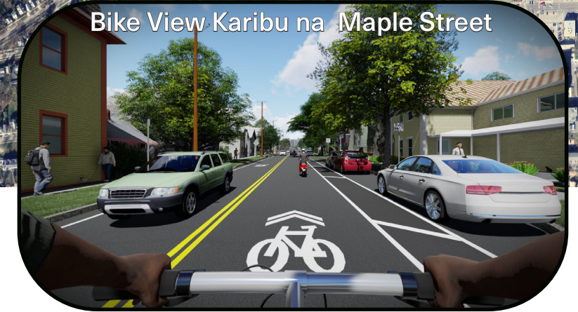
Bike View Karibu na Maple Street

Champlain pakway ITAENDELEA KUPITIKA kati ya I-189 / U.S. njia 7 ya wilaya ya katikati ya mji wa Burlington na eneo la chini ya mji lenye maji; KUBORESHA MZUNGUKO, UFIKIAJI, NA USALAMA katika mitaa; KUPUNGUZA MISONGAMANO kusini magharibi mwa Burlington; kuondoa usumbufu katika mitaa; KUTENGA MITAA NA MISONGAMANO ; na KUPUNGUZA MISONGAMANO YA MAGARI katika mtandao wa mitaa ya ndani.