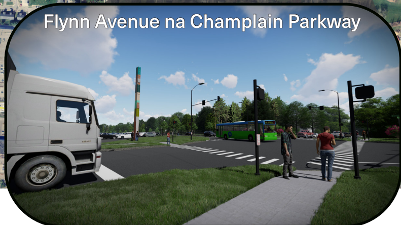
Flynn Avenue na Champlain Parkway