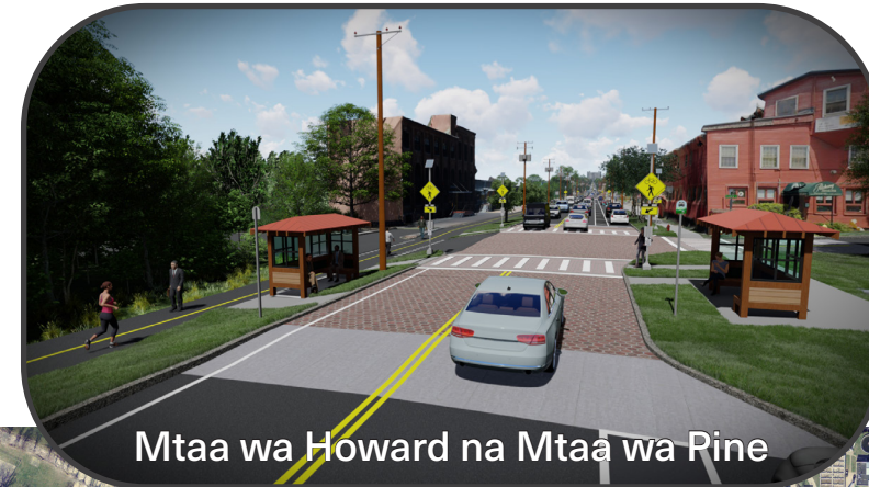
Mtaa wa Howard na Mtaa wa Pine