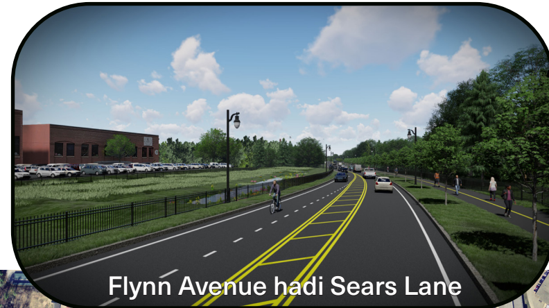
Flynn Avenue hadi Sears Lane