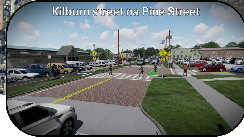
Kilburn street na Pine Street