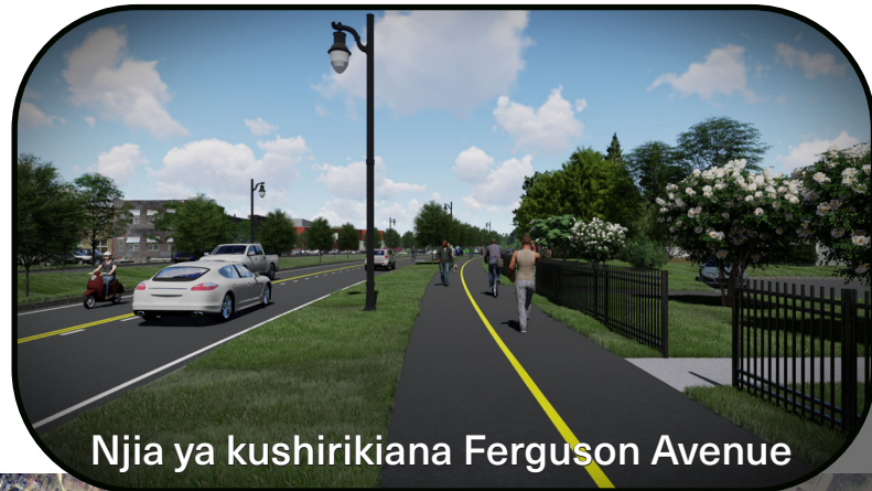
Njia ya kushirikiana Ferguson Avenue