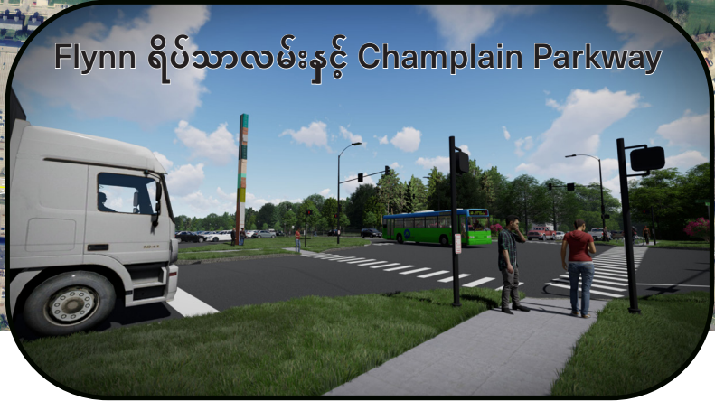
Flynn ရိပ်သာလမ်းနှင့် Champlain Parkway