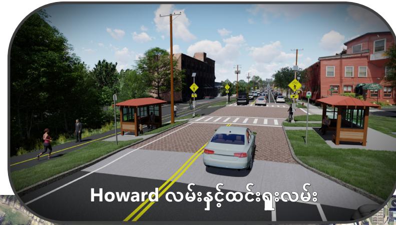
Howard လမ်းနှင့်ထင်းရူးလမ်း