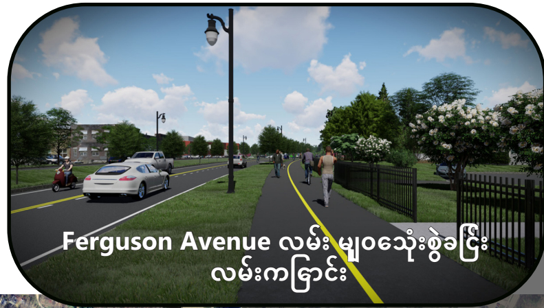
Ferguson Avenue လမ်းမျှဝေသုံးစွဲခင်း လမ်းကခြင်း