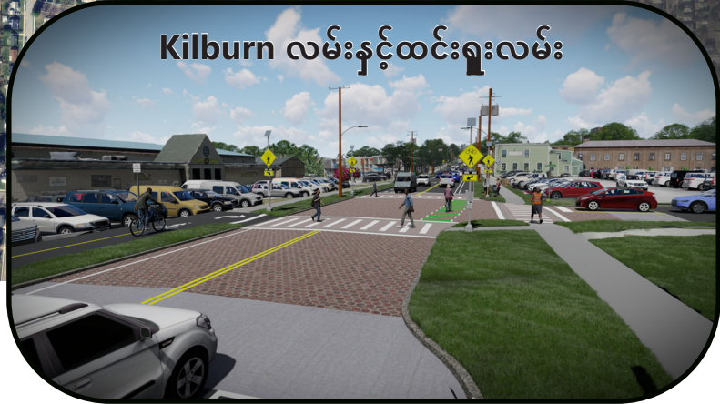
Kilburn လမ်းနှင့်ထင်းရူးလမ်း