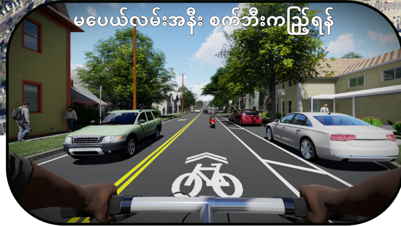
မပေယ်လမ်းအနီး စက်ဘီးကညိရန်

Champlain Parkway သည် I-189 / U.S. Route 7 လမ်းဆုံမှ Burlington City Center District နှင့် downtown waterfront ရေိယာ အကခြ်း ဒေသတွင်း လမ်းများပေါ်တွင် ယာဉ်ရှုလျှောက်ခိုင်စွမ်း၊ သွားလာနိုင်စွမ်းနှင့် လုံခြုံမှုတို့ကို တိုးမြှင့်ခင်း၊ Burlington ၏ အနောက်တောင်ပိုင်းတွင် ရှိသော ယာဉ်ပိတ်ဆို့မှုကို ဖြေလျှော့ခင်း၊ ဒေသခံ ရပ်ကွက်များအပေါ် အနှောင့်အယှက်ဖြစ်ခင်းမှ ကင်းဝေးစေခင်း၊ ဒေသတွင်းနှင့် ဖြတ်သန်းသွားလာမှု ယာဉ်ကခြ်း ခွဲခင်းခင်း၊ ဒေသတွင်း လမ်းကွန်ယက်ရှိ ကုန်တင်ယာဉ်များ သွားလာမှုကိုလျှော့ချခင်း အစရှိသည့် ယာဉ်သွားလာနိုင်မှုကို တိုးတက်အောင် ပြုလုပ်မည်။