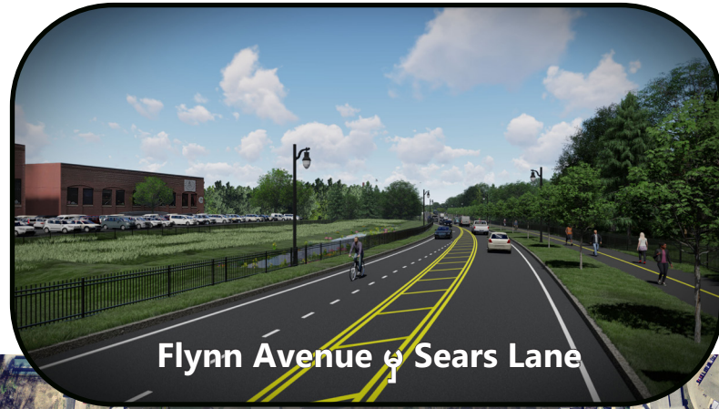
Flynn Avenue မှ Sears Lane